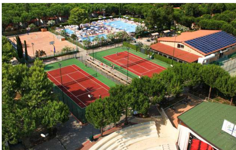
Immagine area sportiva interna al Villaggio

Oltre 10 mila metri quadrati per un'area del villaggio all'insegna dello sport. Tennis, basket, minigolf, calcetto, pallavolo e tanto altro, fino ad arrivare ad un bellissimo percorso-vita e alle piscine. Le nostre strutture sono dotate di: 2 campi da tennis (illuminazione notturna); 2 campi bocce (illuminazione notturna); 1 campo polivalente basket e pallavolo (illuminazione notturna) ; 1 campo minigolf (illuminazione notturna) ; 1 campo di calcetto 5 contro 5 (illuminazione notturna)*; 1 campo di calcetto 2 contro 2; 3 piscine , 1 vasca idromassaggio; Beach Volley; Percorso vita; Tiro con l'arco ; Ping-pong ; Calcio balilla ; Teleferica per bimbi.